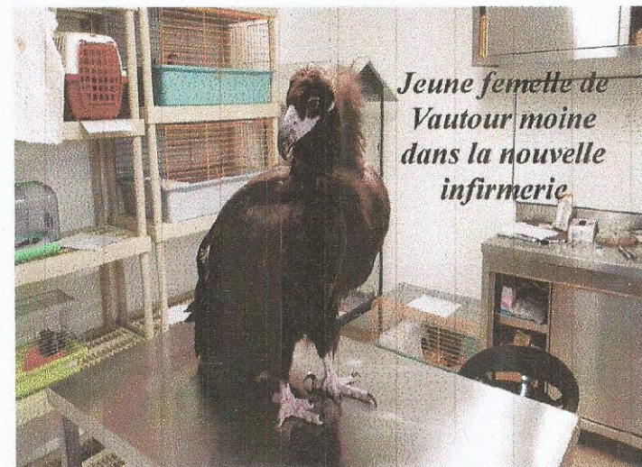
Jeune femelle de Vautour moine dans la nouvelle infirmerie